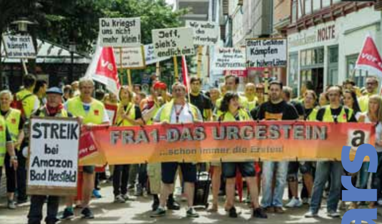
Demonstration der Amazon-Beschäftigten am 11. Juli 2017 in Bad Hersfeld